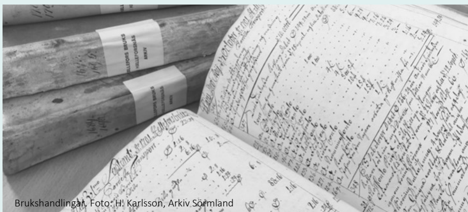
Brukshandlingar.